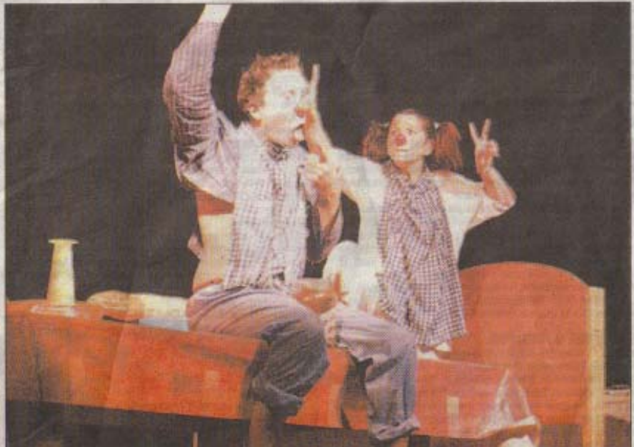
Un couple de clowns drôles à souhait.

Suite à leur participation à l'exposition "les nuits d'Amnesty", les enfants de l'école publique de Saint Sernin et privée de Vals les bains et Lalevade, ont pu assister au spectacle